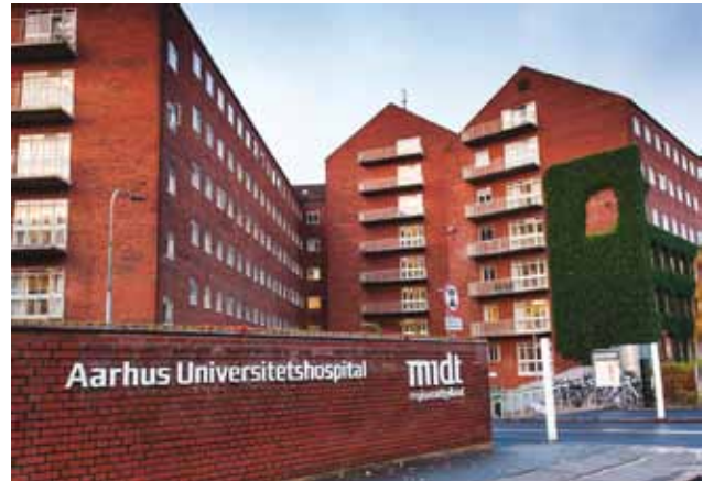
Aarhus Universitetshospital, Nørrebrogade.

I undersøgelsen mener kun syv pct., at der er tilstrækkeligt med personaleressourcer og optimale fysiske rammer. 14 pct. siger, at der er tilstrækkeligt med tid – og kun 10 pct. mener, at der er de nødvendige retningslinjer for inddragelse arbejdet.