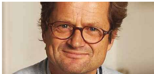
Klaus Müller.

Nogle kræftpatienters immunsystem er hurtigere til at genopbygge sig selv end andres, og dette styres af særlige immunhormoner, hvis profil varierer fra patient til patient på baggrund af blandt andet arvelige forskelle.