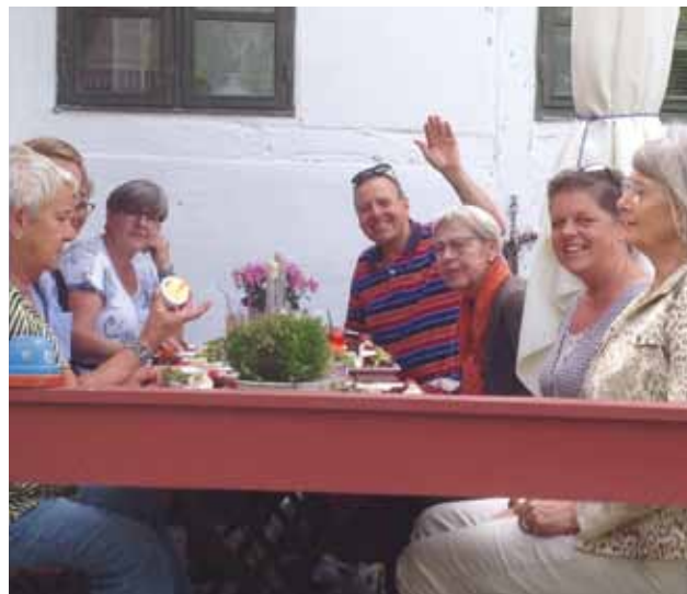
Deltagerne nød naturen, vejret og en kop kaffe